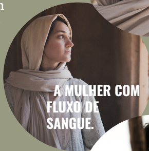
A MULHER COM FLUXO DE SANGUE.

Evidentemente, ela queria essas coisas temporais mais do que queria Deus. No entanto, Rute optou por permanecer com sua sogra e servir ao único Deus verdadeiro, ainda que isso não trouxesse bênçãos materiais. Rute estava comprometida com a verdade e Deus recompensou sua fé—não apenas ela se casou novamente e teve filhos, mas Cristo foi contado entre seus descendentes.