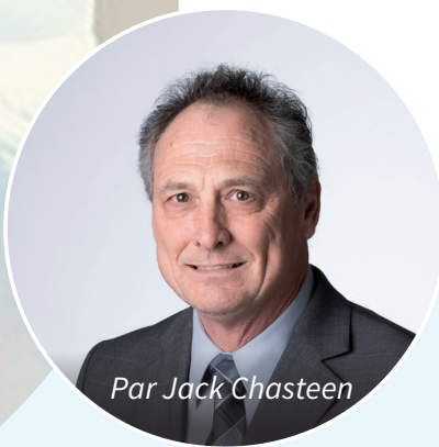
Par Jack Chasteen

Le Saint-Esprit attire les pécheurs à la repentance et enseigne, guide et donne du pouvoir aux croyants.