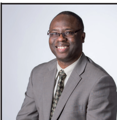
Par Olulana Alofe