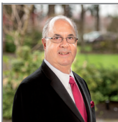
Par Darrel Lee