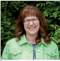
Par Jodie Hinkle