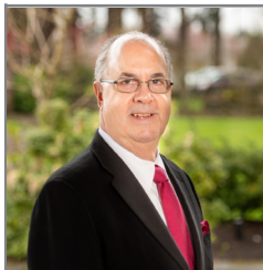
Por Darrel Lee