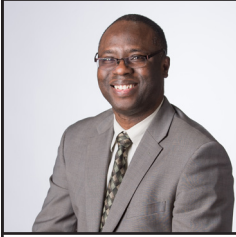
Por Olulana Alofe