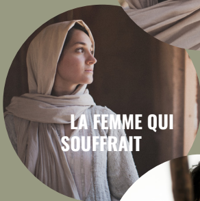
LA FEMME QUI SOUFFRAIT